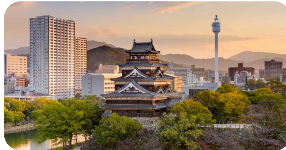
Castillo de Hiroshima