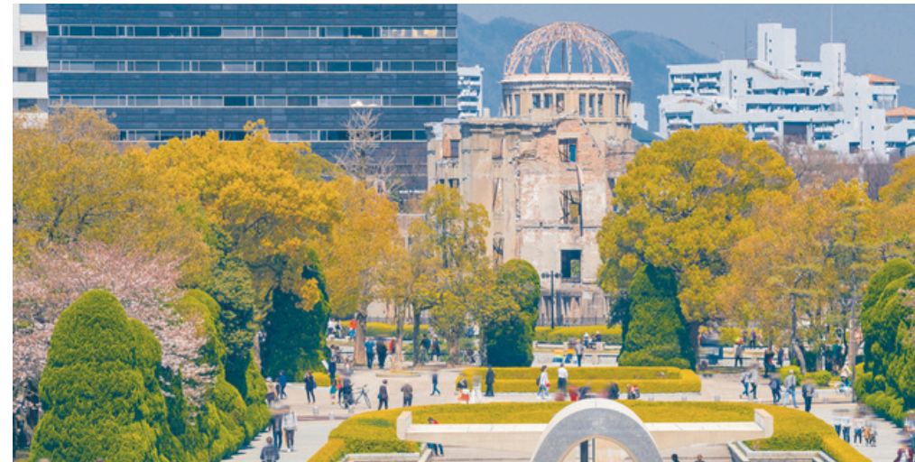
Parque de la Paz