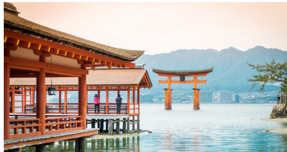
Torii de Miyajima